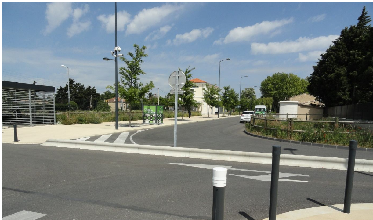
Entraigues : La gare et ses nouveaux abords