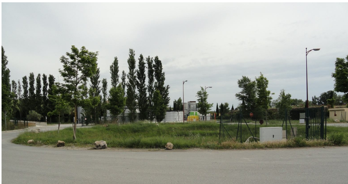
Entraigues : Bassin d'orage dans la ZAC du plan de Trévouse