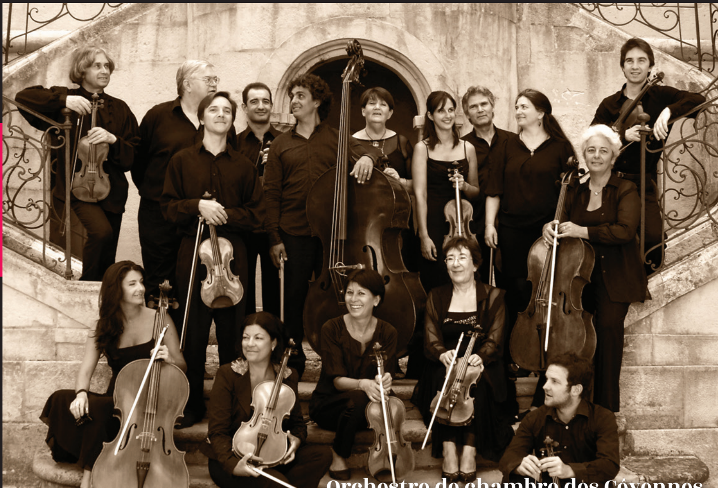
Orchestre de chambre des Cévennes