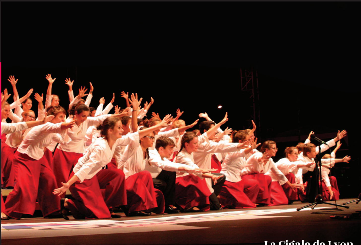
La Cigale de Lyon