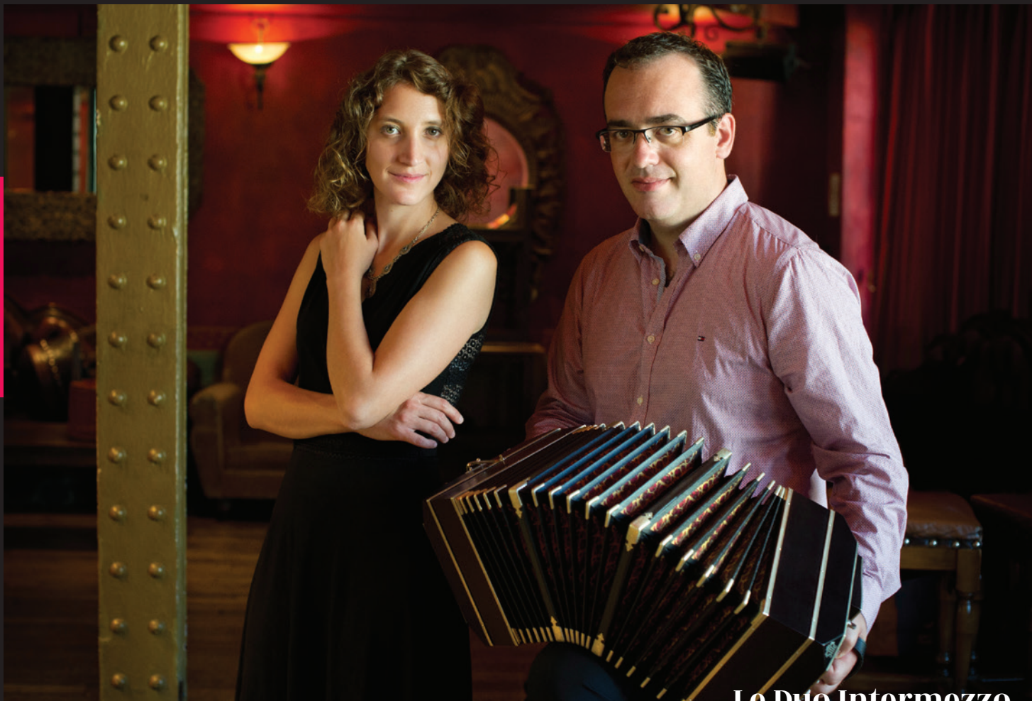
Le Duo Intermezzo