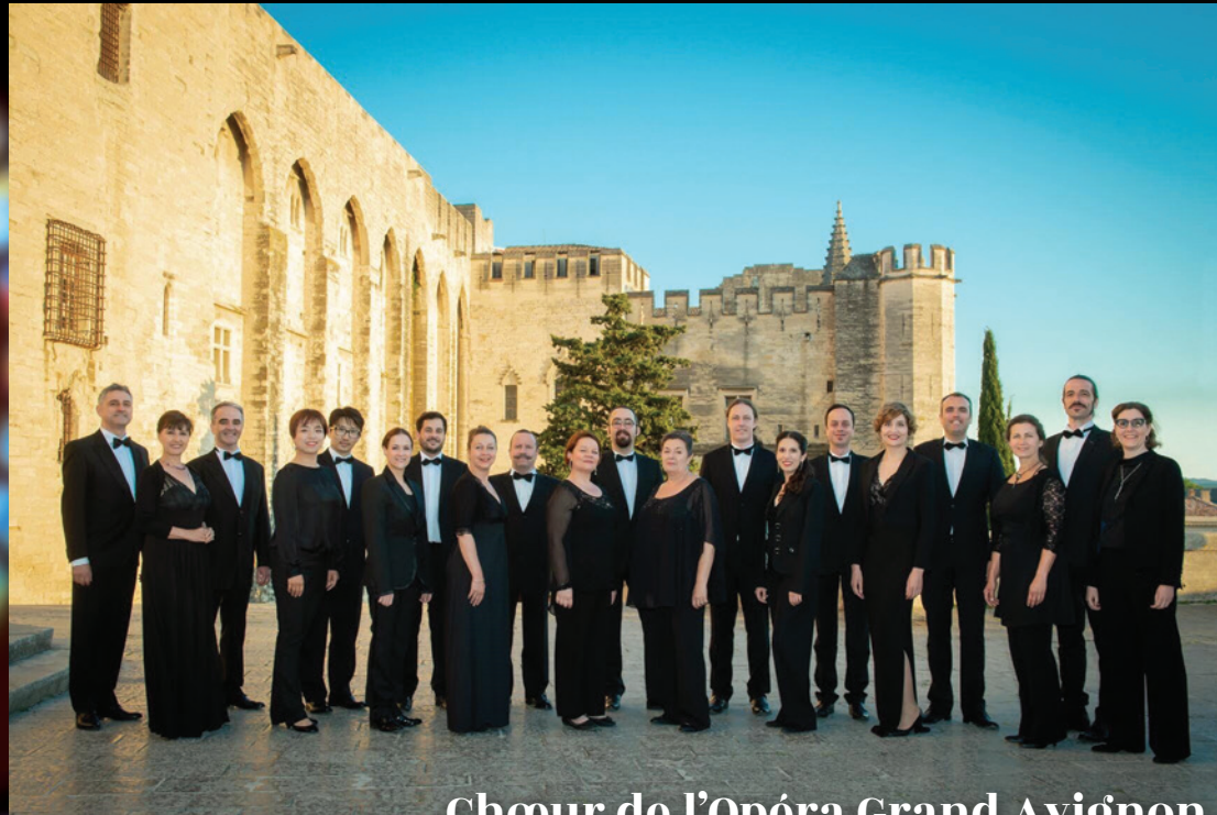
Chœur de l'Opéra Grand Avignon