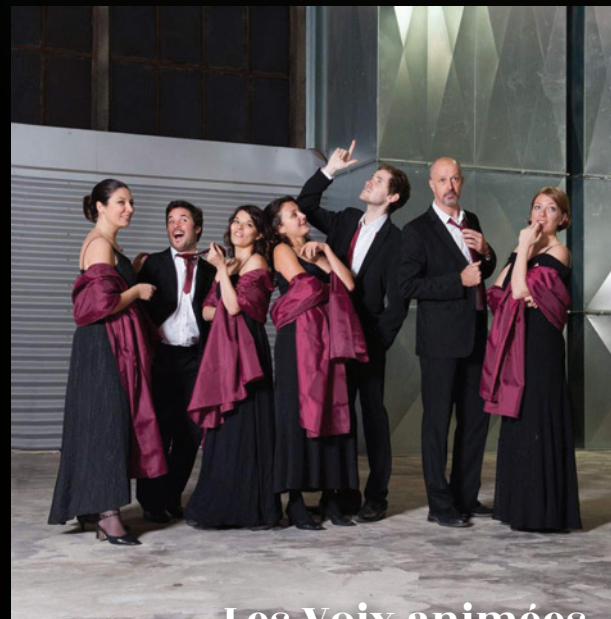
Les Voix animées